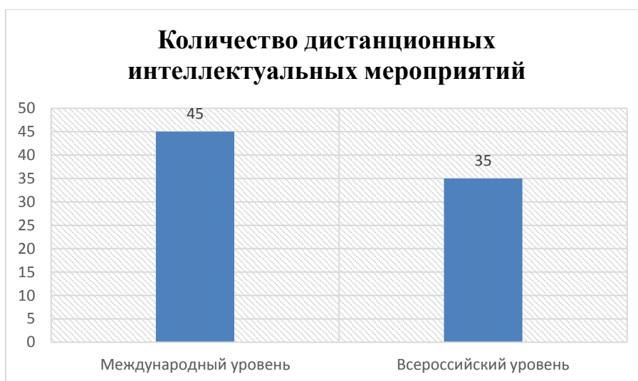
Рис.4. Количество дистанционных интеллектуальных мероприятий

В 2016/2017 учебном году учителями-предметниками была организована возможность широкого участия в дистанционных интеллектуальных мероприятиях всероссийского и международного уровня (Рисунок 4), тем самым каждый лицеист имеет возможность выбора среди различных интеллектуальных проектов того, который станет интересным лично ему. Координаторами участия в конкурсах стали 36 педагогов (65%).