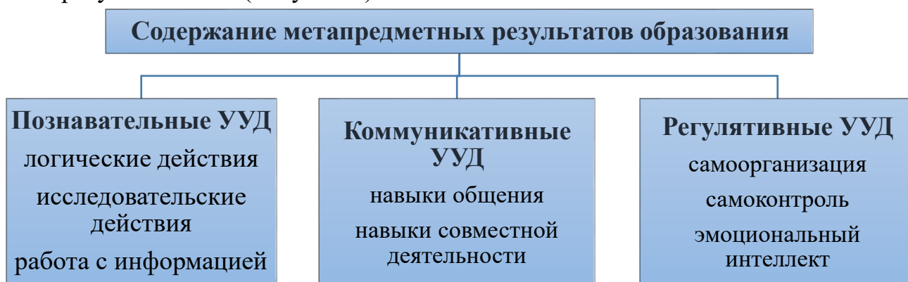
Рис. 3. Содержание метапредметных результатов образования

учебные действия, составляющие умение овладевать универсальными учебными действиями: познавательными; коммуникативными; регулятивными (Рисунок 3).